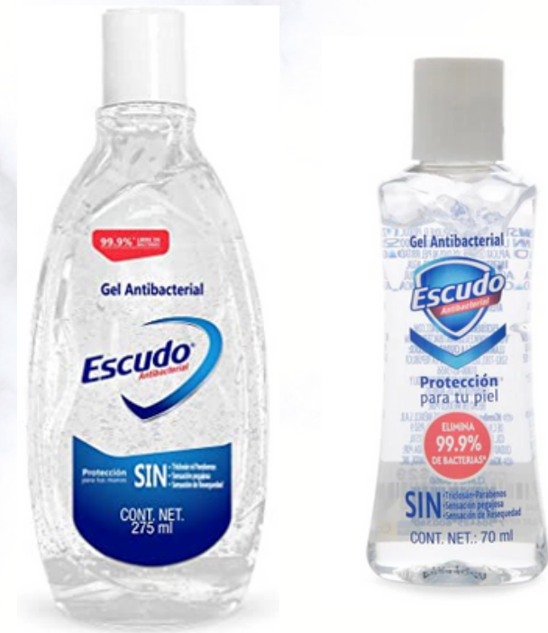
Gel antibacterial (distintas marcas y presentaciones)